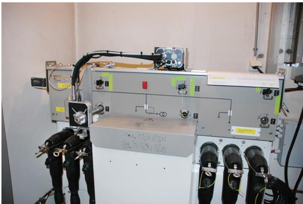
Рис. 3. Применение двигателя LINAK в периферийном устройстве. Вид спереди

Выбранная компанией Stedin архитектура является полностью децентрализованной. Весь интеллект системы распределен между несколькими узлами. Алгоритм FLIR использует сообщения, приходящие от некоторого количества RTU. Поскольку такая архитектура связи отражает структуру сети, это упрощает добавление и удаление узлов.