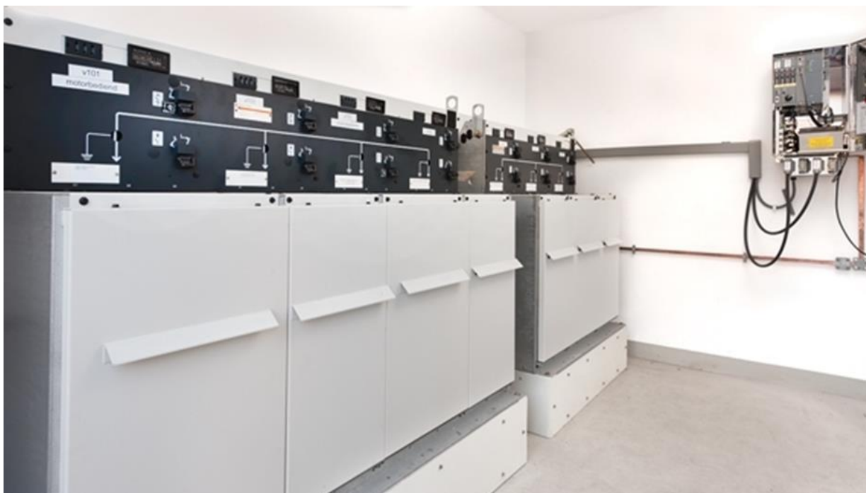
Рис 1. На фотографии низковольтной вторичной подстанции на 23 кВ показано высоковольтное распределительное оборудование и смонтированное на стене устройство T200 компании Schneider Electric.

Рост экономики и увеличение численности населения приводят к увеличению спроса на электроэнергию. Эта ситуация, вместе с жесткими ограничениями на качество и надежность поставок энергии, увеличивает усилия, требуемые от сетей распределения, для обеспечения целостности сети. Несмотря на огромные затраты на замену стареющего оборудования, позволяющие минимизировать вероятность отказов, все равно полностью устранить шансы возникновения отказов невозможно. Поэтому, когда происходят отказы сетей, перед их владельцами стоит задача минимизировать последствия этих отказов, снижая время выхода из строя, и количество потребителей, не получающих электроэнергию.