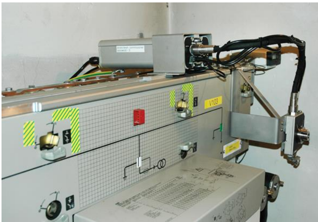
Рис. 4. Применения двигателя LINAK в оборудовании кольцевой магистрали. Вид сбоку