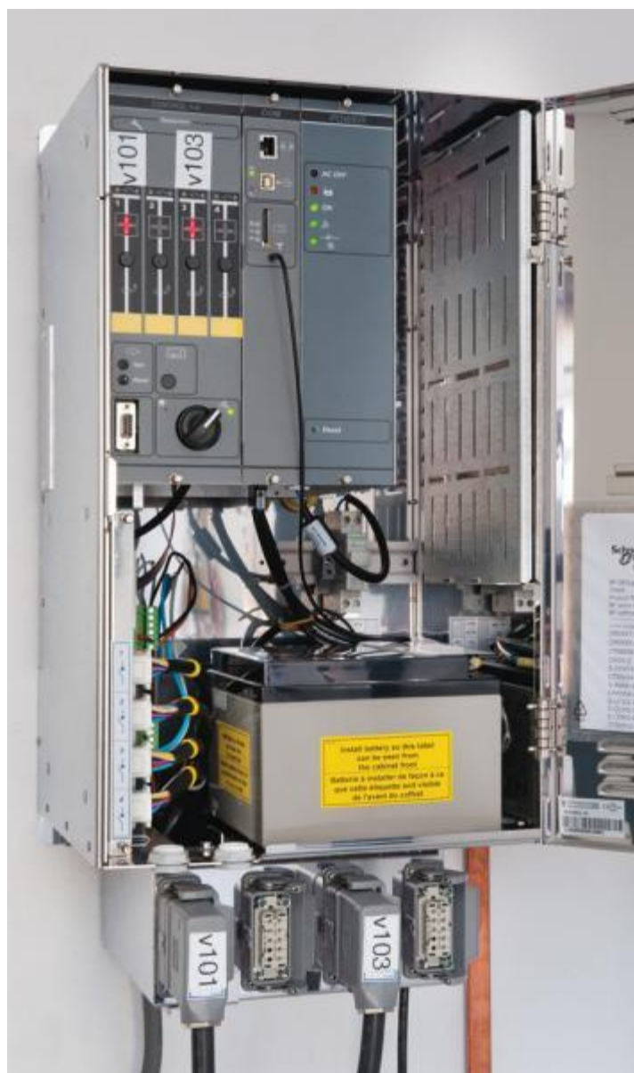
Рис. 2. На фотографии устройства T200 компании Schneider Electric видны подключения двигателей а также батарея, модем и периферийное устройство