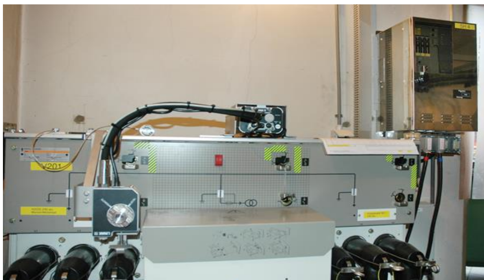
Рис. 5. Вид точки штатного размыкания с двигателем LINAК.

Последовательность операций поиска и изолирования отказа начинается, когда контроллер основной подстанции обнаруживает срабатывание защитного реле. Работа алгоритма выполняется в две фазы. Первая фаза представляет собой процесс изолирования "против течения": в нем каждый узел анализирует, находится ли отказ выше его, и, при необходимости, изолирует участок перед собой. На втором этапе выполняется изолирование "по течению": каждый узел анализирует, расположен ли отказ ниже его, и при необходимости, изолирует участок после себя.