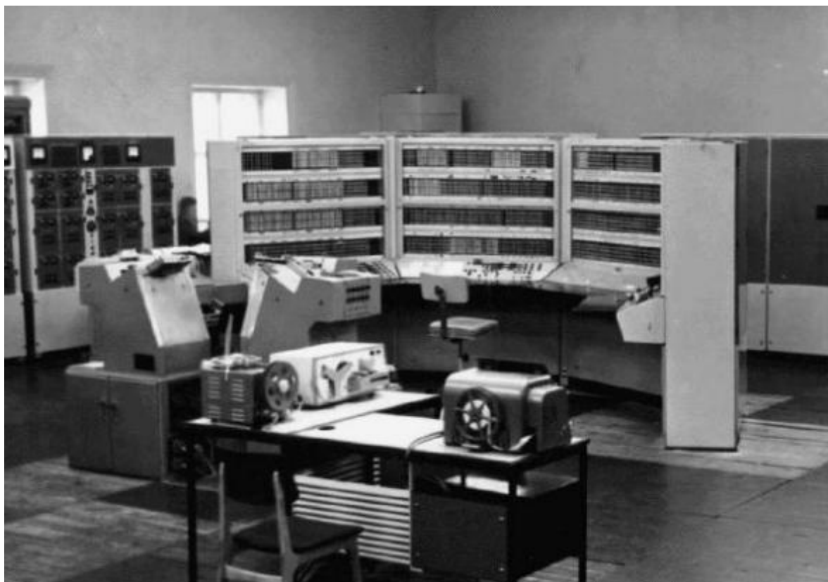
БЭСМ-6, созданная в СССР в 1966 году, обладала рекордным для того времени быстродействием — около миллиона операций в секунду

Первой полноценной машиной второго поколения (на полупроводниковой основе) стала БЭСМ-6. Эта машина обладала рекордным для того времени быстродействием — около миллиона операций в секунду. Многие принципы ее архитектуры и структурной организации стали настоящей революцией в вычислительной технике того периода и, по сути, были уже шагом в третье поколение ЭВМ.