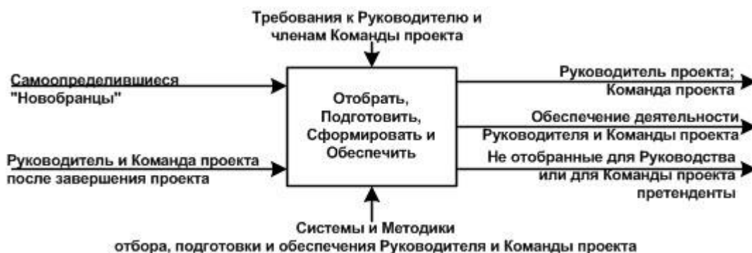
Рисунок 3. Структура системы отбора и формирования управляющих и команды проекта

Процесс подготовки руководителей проектов включает как прохождение профессиональной подготовки и обучение, так и получение практических навыков в процессе работы в составе команд проектов. Схематически структура отбора и подготовки руководителей проектов представлена на рисунке 3.