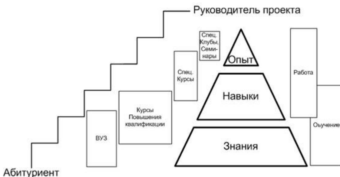
Рисунок 2. Структура системы подготовки и отбора руководителей проектов

Приведенные уровни подготовки, как правило, последовательно следуют друг за другом (сначала обучение в вузе, затем повышение квалификации, получение дополнительного образования и обучение в процессе работы), но могут налагаться и пересекаться. Схематически этот процесс представлен на рисунке 2 .