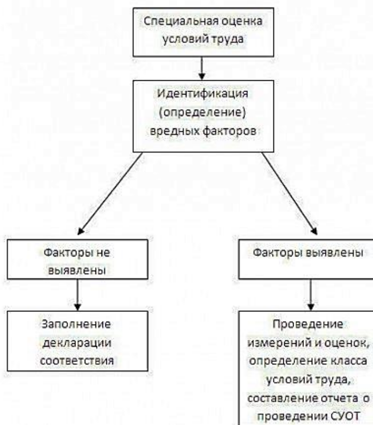
Схема 1 «Проведение специальной оценки условий труда»

Таким образом, в отличие от АРМ при СОУТ измерения факторов производственной среды и трудового процесса могут проводиться не на всех рабочих местах!